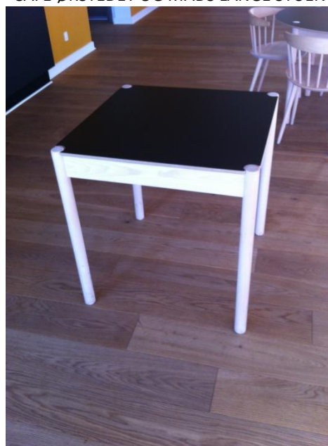
BORDE MED VENDBARE PLADER 5 STK. DIM: 70 X 70 CM.

DE 8 RUNDE BORDPLADER I CAFE ØRSTEDET KAN UDSKIFTES MED 8 PLADER DIM. 70 X 70 CM. SÅLEDES AT DER KAN SKABES PLADS TIL 74 PERSONER VED FIRKANTEDE BORDE.