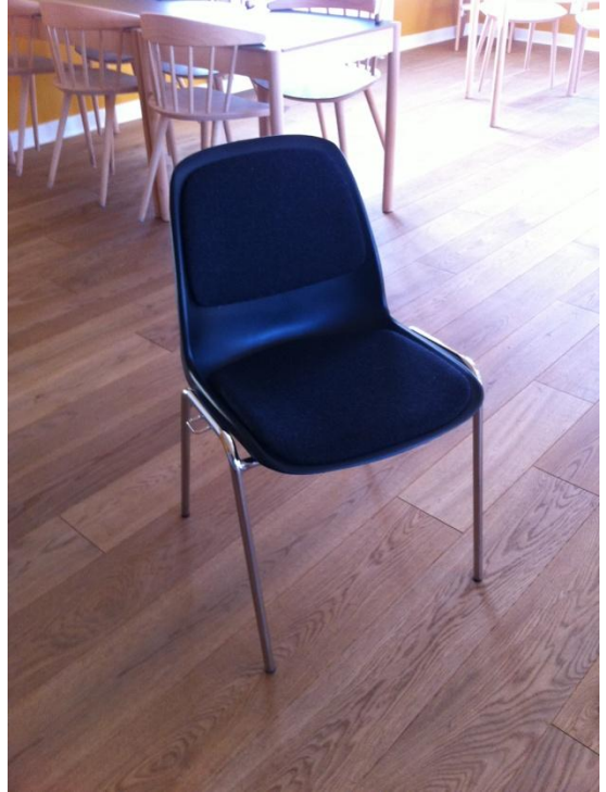
STABELBARE SKALSTOLE 250 STK.