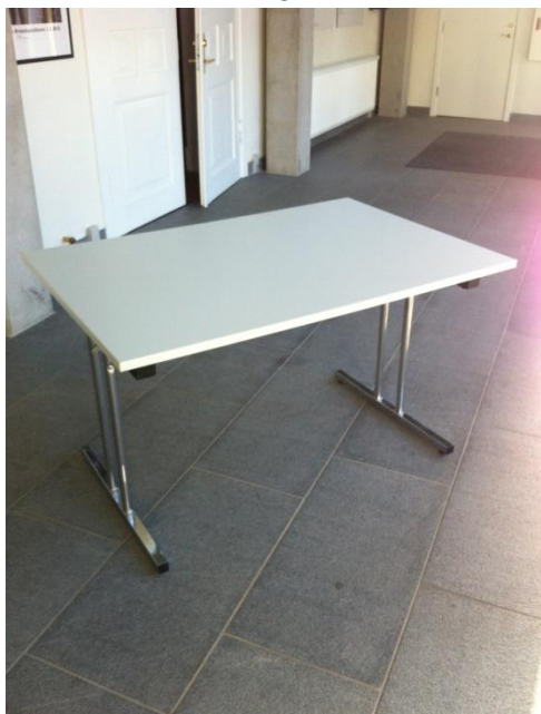
KLAPBORD DIM: 80 x 120 cm. 48 STK.