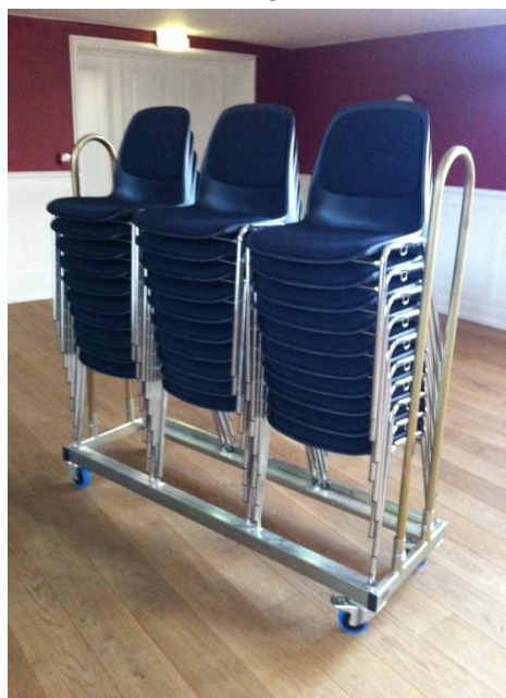
SKALSTOLE SAT PÅ VOGN 30 STK. PR. VOGN