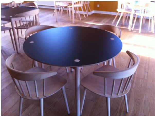
RUNDE CAFE BORDE MED VENDBARE PLADER Ø 110 CM. 8 STK.

SE LÆNGERE NEDE HVORDAN DISSE BORDE KAN ÆNDRES TIL KVADRATISKE BORDE DIM. 70 X 70 CM.