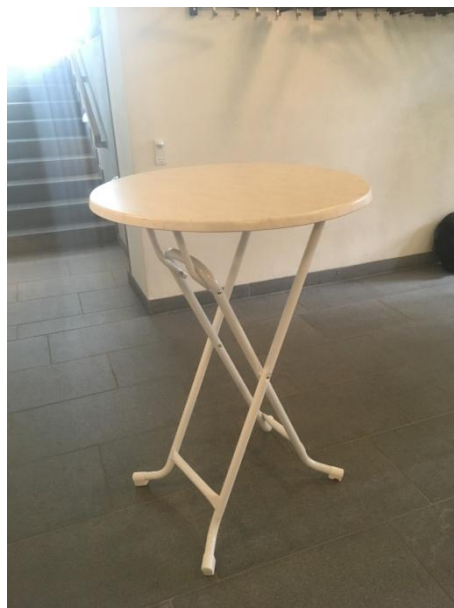
CAFEBORDE SAMMEKLAPPELIGE 10 STK. Ø 80 CM. H. 110 CM.