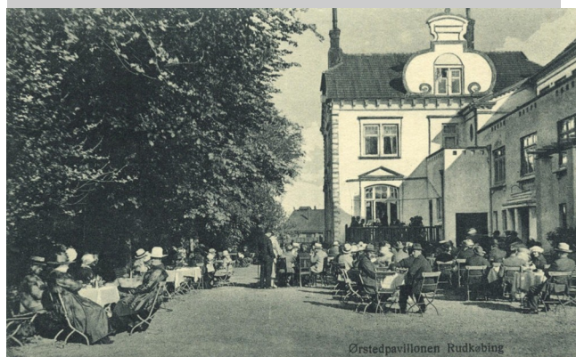
Servering i haven bag ØP.