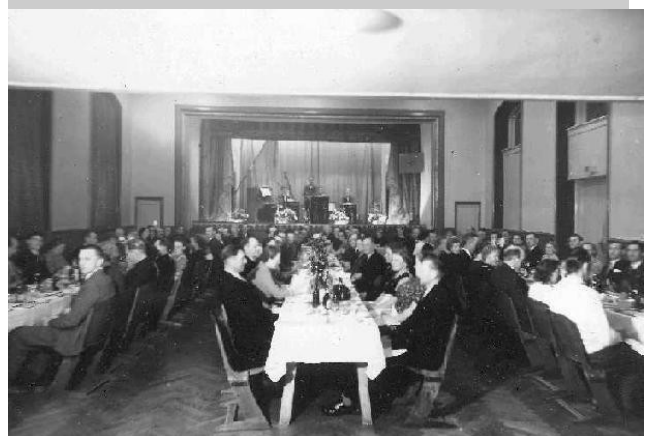
1950 Lagonis Orkester spiller til middagen.