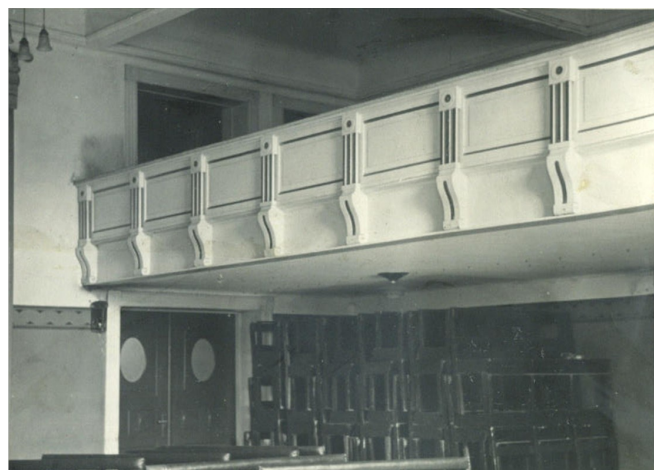
Den oprindelige udsmykning salens ene balkon.

I 1916 afviklede Borgerforeningen for eksempel fire spil a 28 gæs, hvor lodsedlerne kostede en krone. Siden