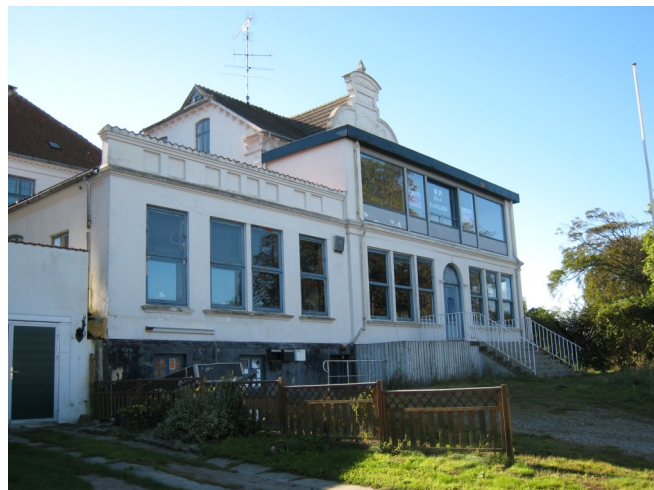
ØP set fra vandsiden 2010.

Borgerforeningens mission var dengang i 1908 som nu at varetage langelændernes kulturelle og selskabelige behov, og de sidste blev langt hen ad vejen dækket med