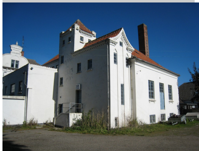
2010: Bagsiden af ØP.

2010 Steen Hauerbach sætter ØP til salg for 3.495.000 kr.