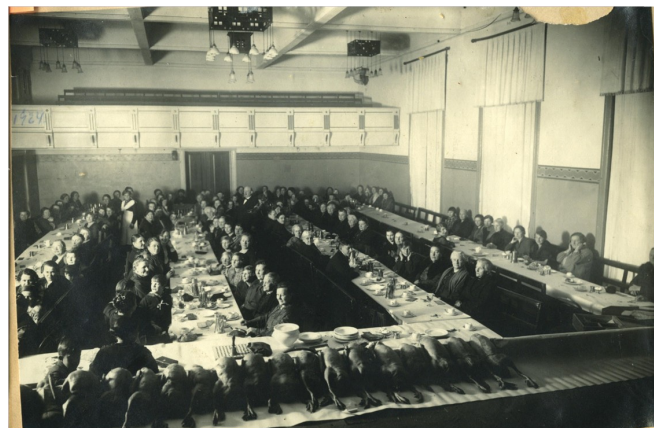
1929: Der spilles. Ænder på lit de parade.

I 1953 sang Gustav Winckler noget så hjertegribende, han var soldat på Langelandsfort og fandt på den måde vej til ØPs scene. Nogle år senere: Minderne om Dario Campeottos optræden på ØP tænder stadig stjerner i mange kvindeøjne.