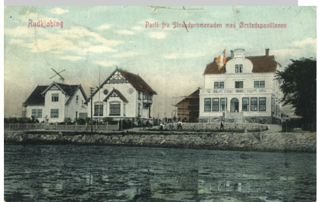
ØP (bygningen til højre) set fra vandsiden cirka 1908.